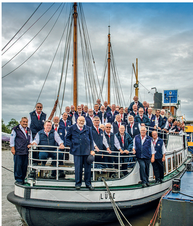
Freuen sich auf ihr Shanty-Festival am 16. und 17. Juli: Der Altländer Shanty-Chor.

Der Altländer Shanty-Chor veranstaltet sein Shanty-Festival – erstmals wieder seit 2019 nach der Corona-Pause und mit einer Überraschung für das Publikum.